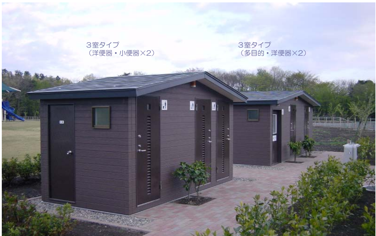
3室タイプ (洋便器・小便器×2)